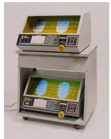
Dos unidades para pies y manos con carrito opcional