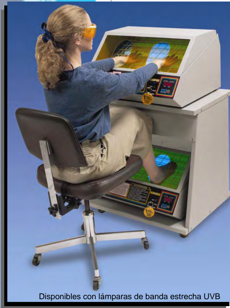
Disponibles con lámparas de banda estrecha UVB